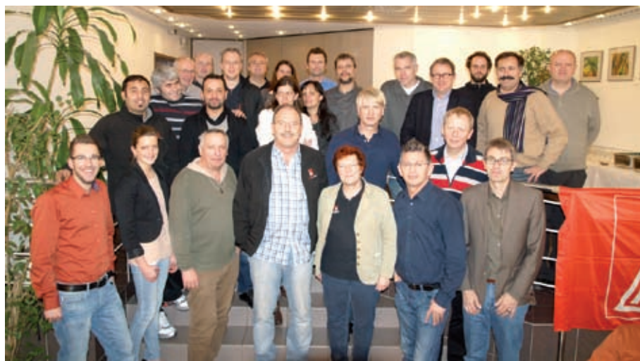
Gute und kraftvolle Interessenvertretung ist nur mit einer mitgliederstarken Gewerkschaft möglich. Auf der Klausurtagung der VKL im Februar wurden die Werber des Jahres 2012 geehrt.

Donnerstag, 21. März 2013, 8:30 Uhr, DS, FCM, Fe 412/1 Speisesaal